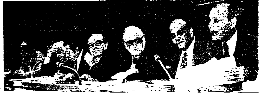
اللجان المشتركة أثناء اجتماعها لمناقشة مشروع تعديل المادة ٩ من قانون الضمان

أقرت لجان المال والوزارة والإدارة والمعدل ، والشؤون الإجتماعية ، في جلسة مشتركة عقدت أمس ، بعض المواد المتعلقة بتعديل المادة التاسعة من قانون الضمان الاجتماعي ، وأرسلت استكمالاً لمشروع القانون إلى مجلس النواب .